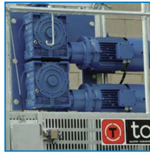
Grupo motriz: motorreductores con electrofreno integrado Drive unit: gearmotors with built-in electric brake