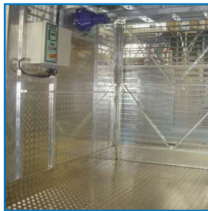
Interior de la cabina Cabin interior