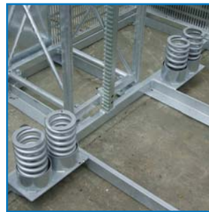
Muelles amortiguadores de seguridad Security spring buffers