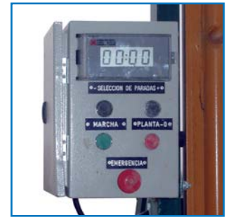
Cuadro digital Digital control panel