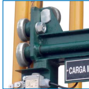
Rodillos guía Guiding rollers