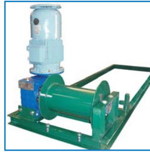
Grupo motriz Drive unit