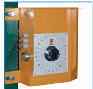
Cuadro analógico Analogic control panel