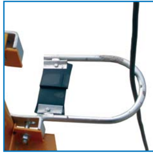
Guía manguera Cable guide