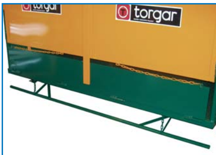
Barra anti-aplastamiento bajo la cabina Security bar under the cabin