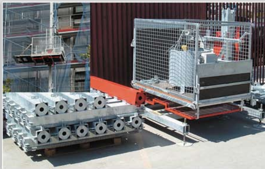
El montacargas ASClimber H-600 usa el mismo mástil