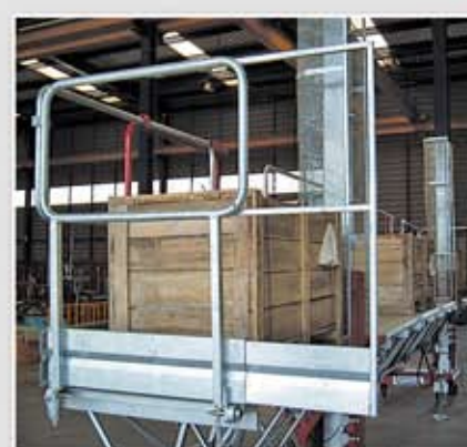
Pasamanos de cabeza deslizable