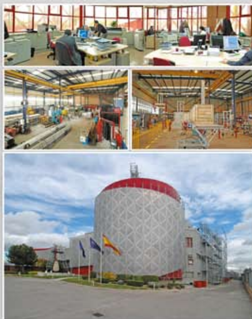
Sede Central del Grupo RESA Área Empresarial Andalucía, Sector 1 C/ Serranía de Ronda, 6-8 • 28320 Pinto, Madrid, España Telf. +34 91 691 85 80 • Fax. +34 91 691 95 12/44 info@gruporesa.es • www.gruporesa.es