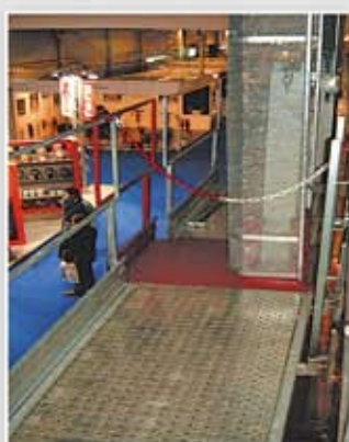
Superficie segura de acero antideslizante