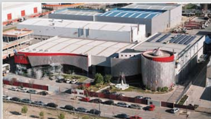
FACTORIA DE PINTO / MADRID Área Empresarial Andalucía, Sector 1 C/ Serranía de Ronda, 6-8 • 28320 Pinto, Madrid, España Telf. +34 91 691 85 80 • Fax. +34 91 691 95 12/44