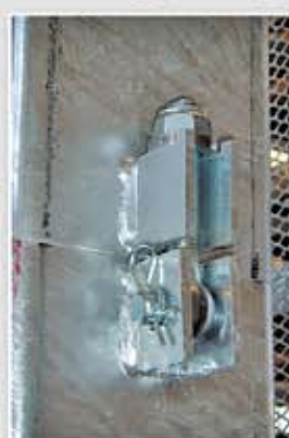
Pernos especiales del mástil